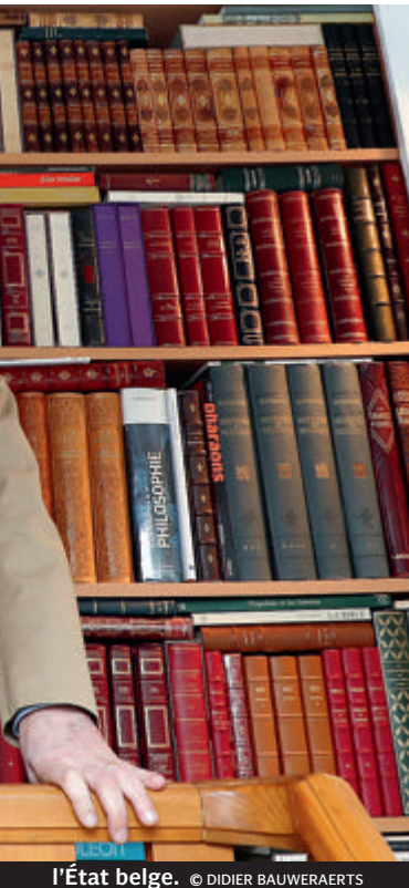
l'État belge.

La Wallonie demain, le dernier ouvrage de Jules Gheude, est publié aux éditions Mols (13 euros)